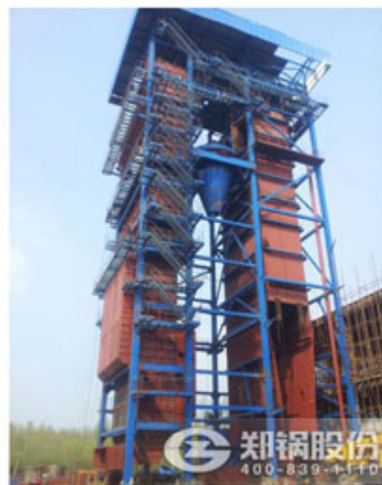
150吨流化床电站锅炉安装现场图片

郑锅五星级的售前、售中、售后服务完美诠释了“心服务，星体验”的服务理念，使得河北东光150吨流化床电站锅炉的安装平稳高效实行，在河北东光150吨流化床电站锅炉后续的安装进度中，郑锅会持续在官网“服务支持—跟踪服务”栏目、官方微信、微博详细介绍，同时您还可以拨打全国免费咨询热线400-839-1110了解更多郑锅一流服务体系。